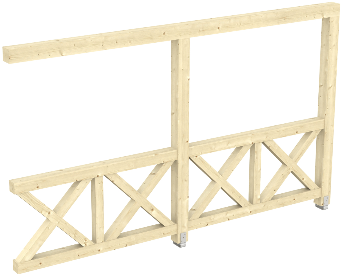
Produktbild AK-Seitenwand 355cm