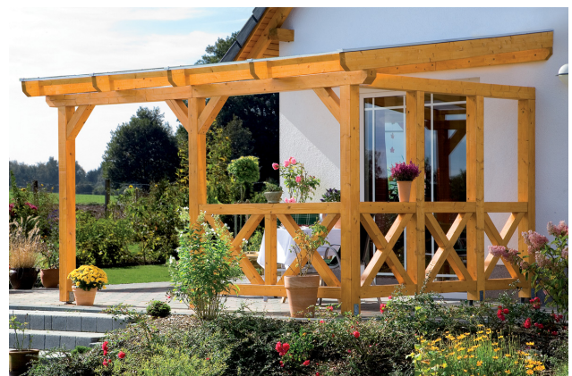
Kundenfoto: Terrassenüberdachung mit einer Brüstung und Seitenwand