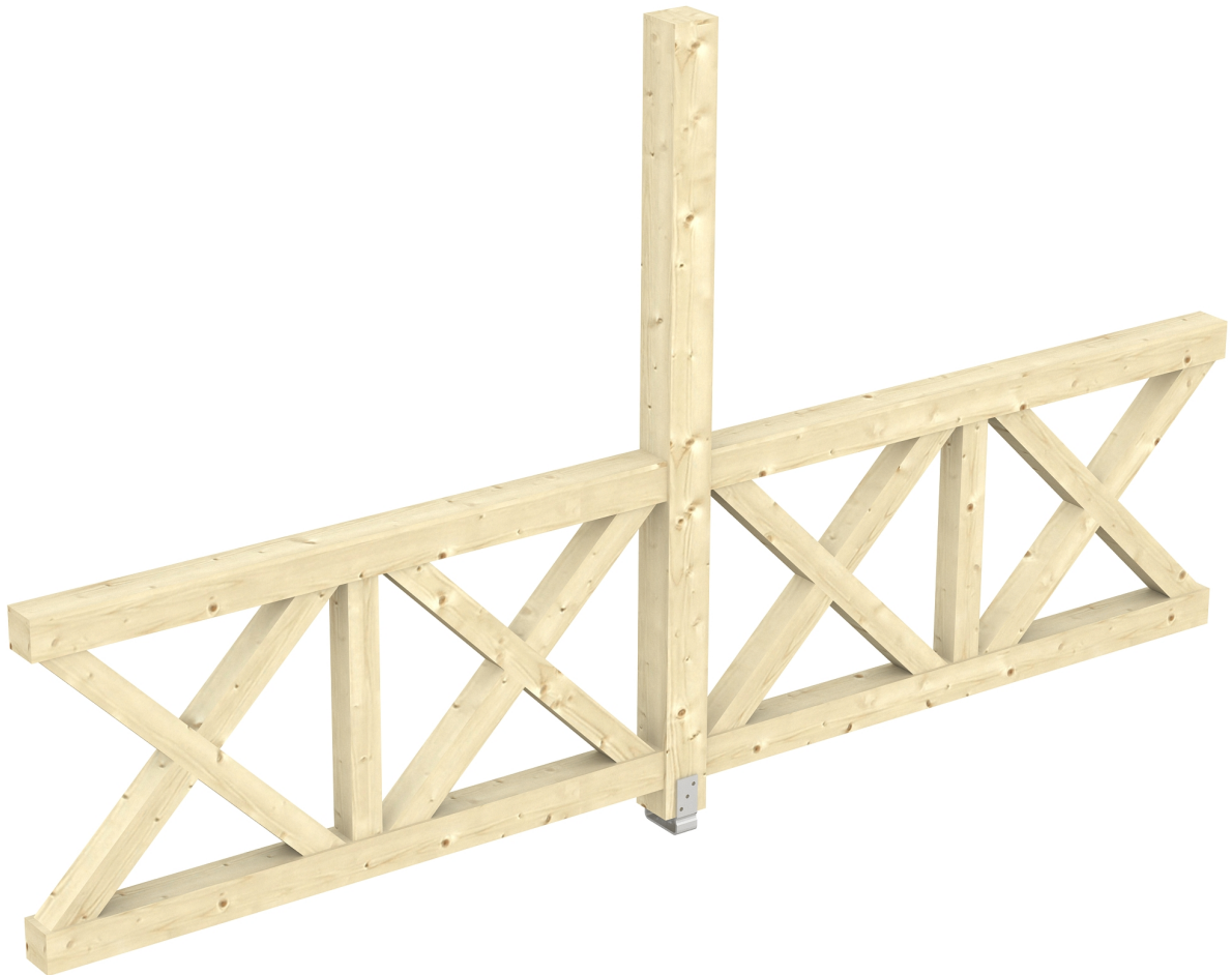
Produktbild AK-Seitenwand 355cm