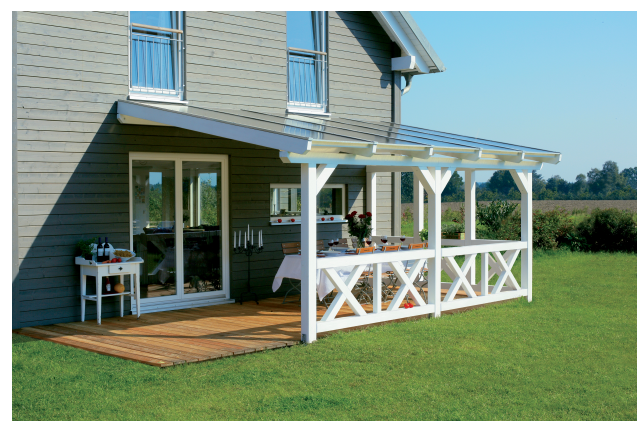
Kundenfoto: Terrassenüberdachung weiss mit 2 Brüstungen und Seitenwand