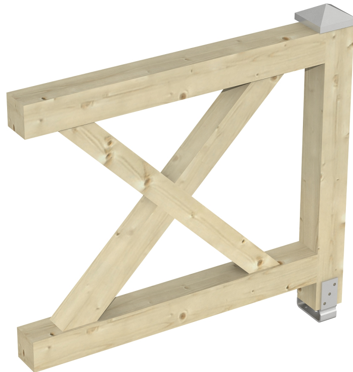
Produktbild AK-Brüstung 108cm