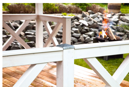
Kundenfoto: Andreaskreuz in weiss