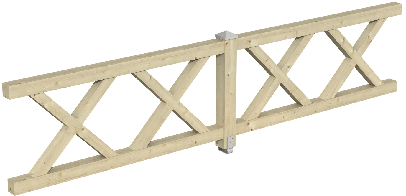
Produktbild AK-Brüstung 400cm