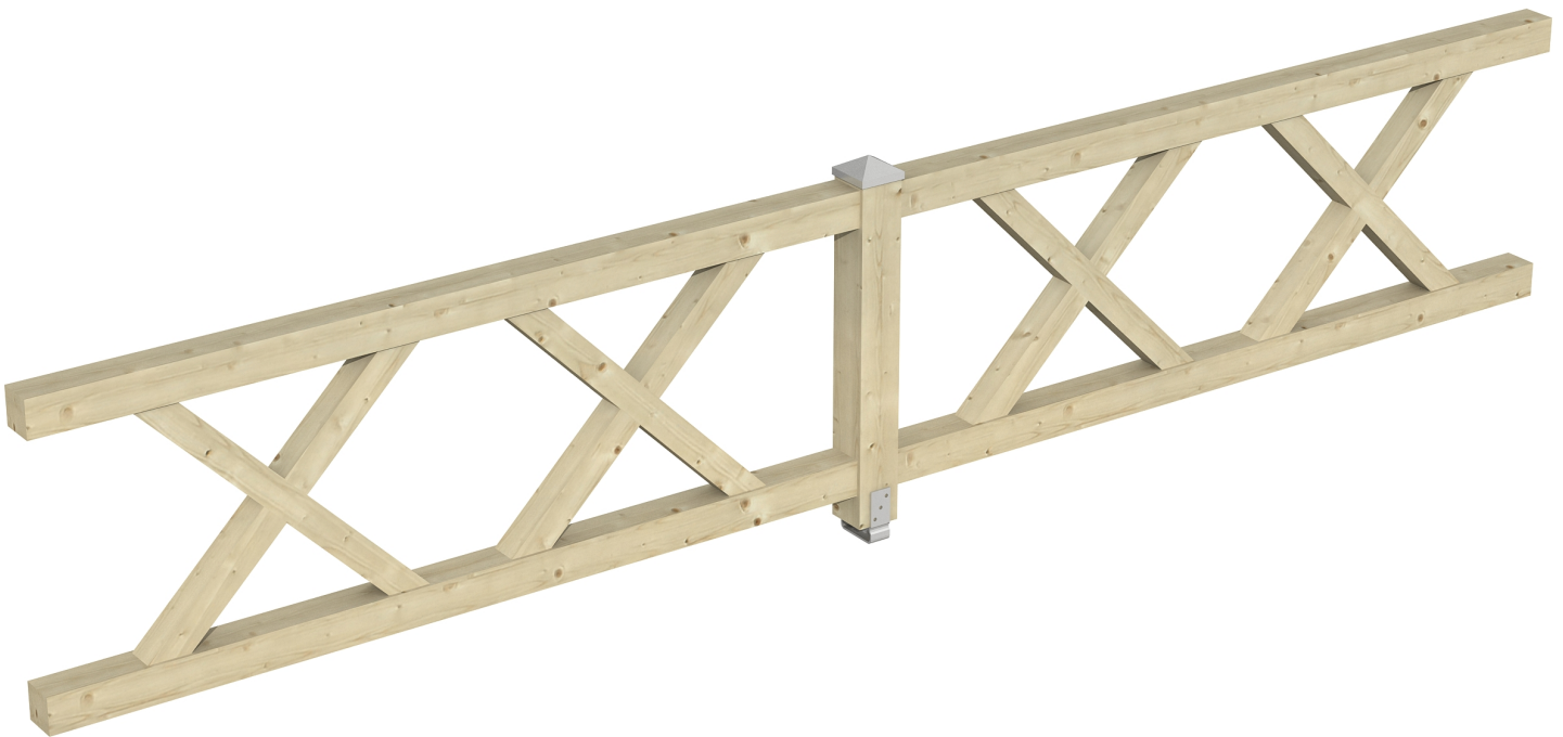
Produktbild AK-Brüstung 465cm