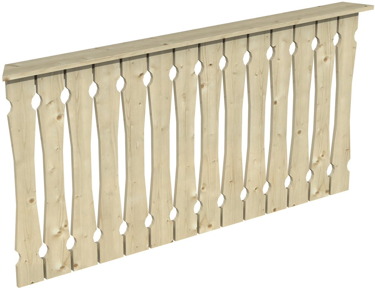
Produktbild Brüstung 180 cm