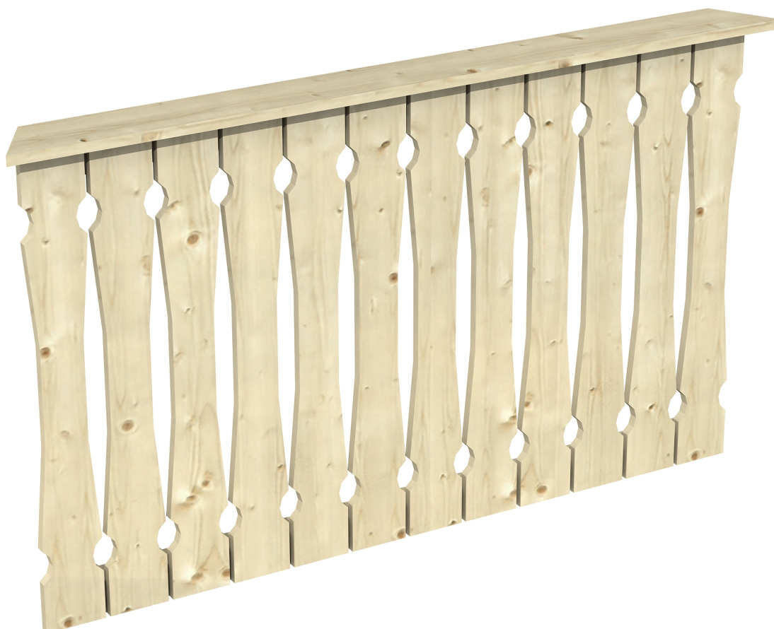
Produktbild Brüstung 150 cm