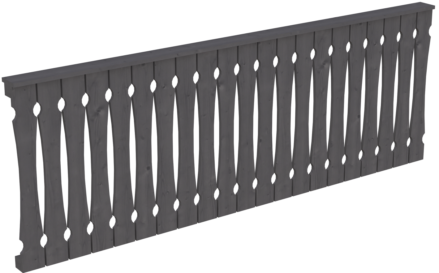
Produktbild AK-Brüstung 270cm