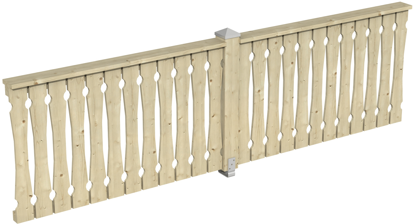
Produktbild Brüstung 335 cm