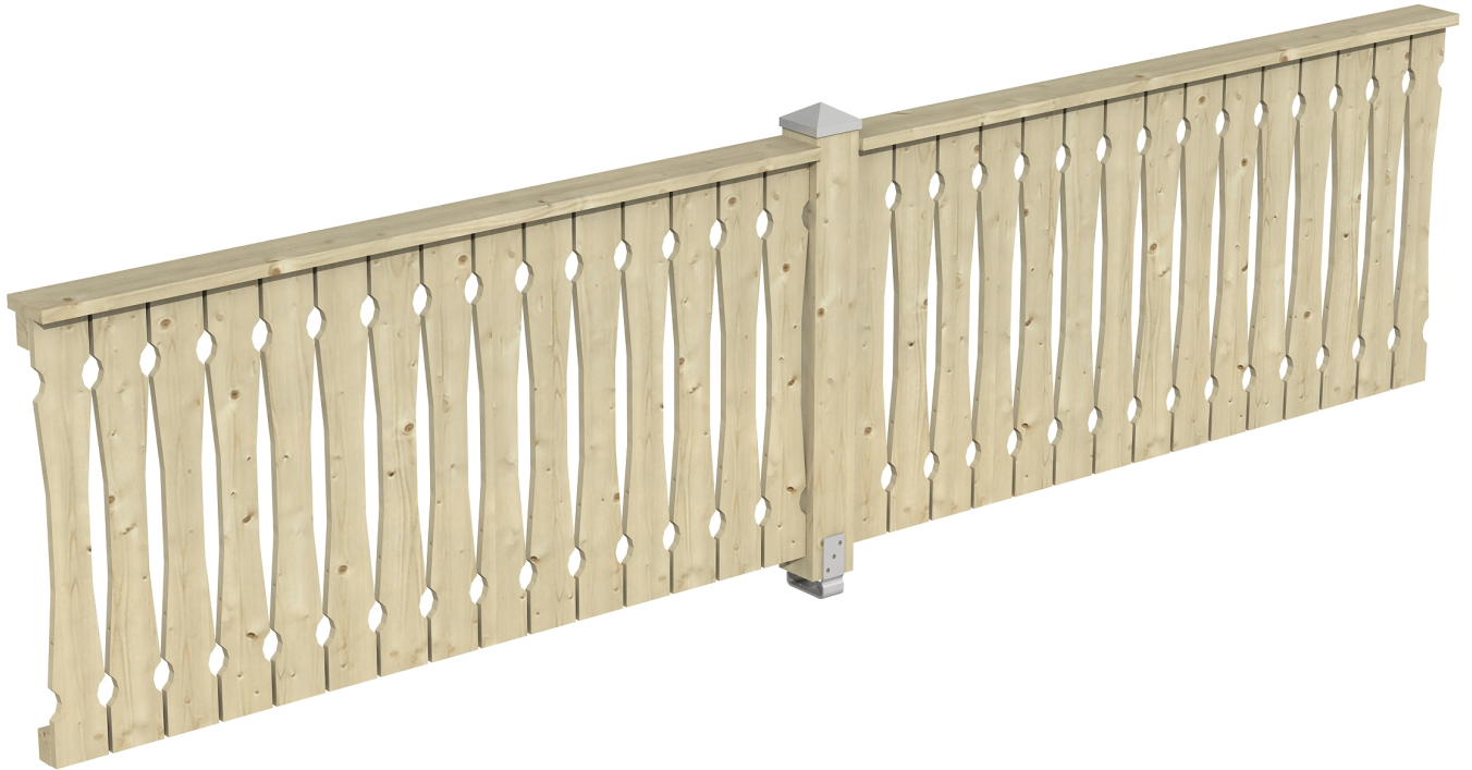
Produktbild Brüstung 400 cm