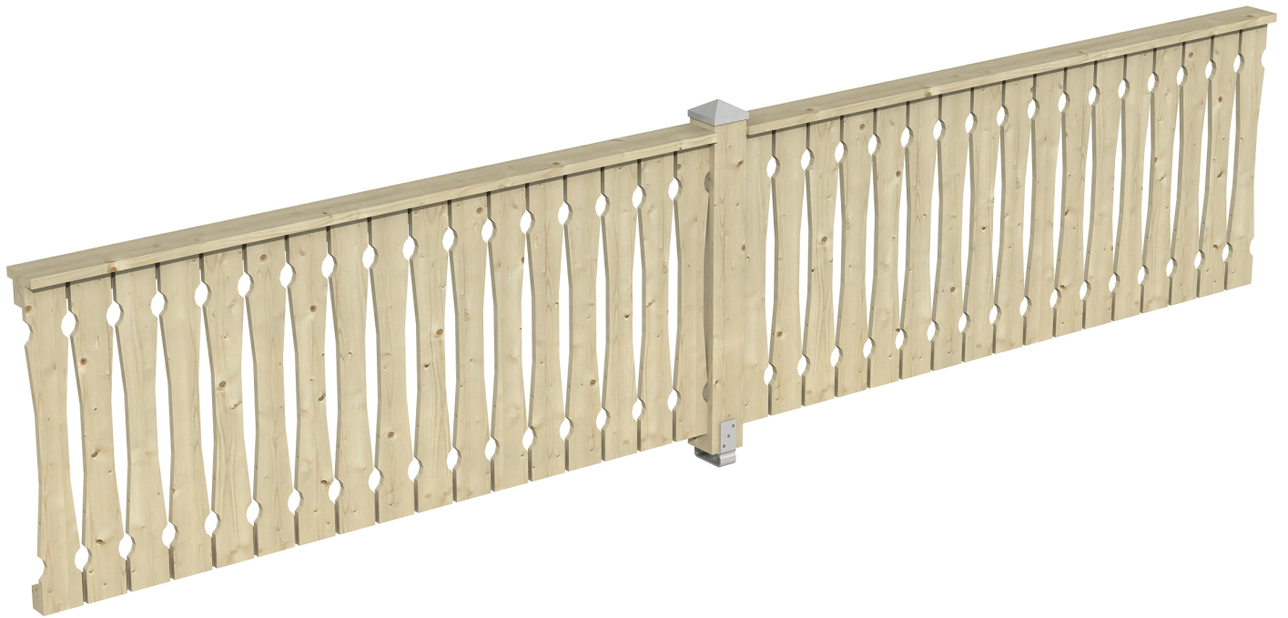
Produktbild Brüstung 465 cm