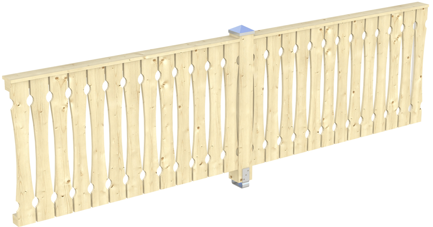
Produktbild AK-Seitenwand 355cm