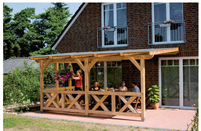
Kundenfoto: Terrassenüberdachung mit Brüstungen und Seitenwand