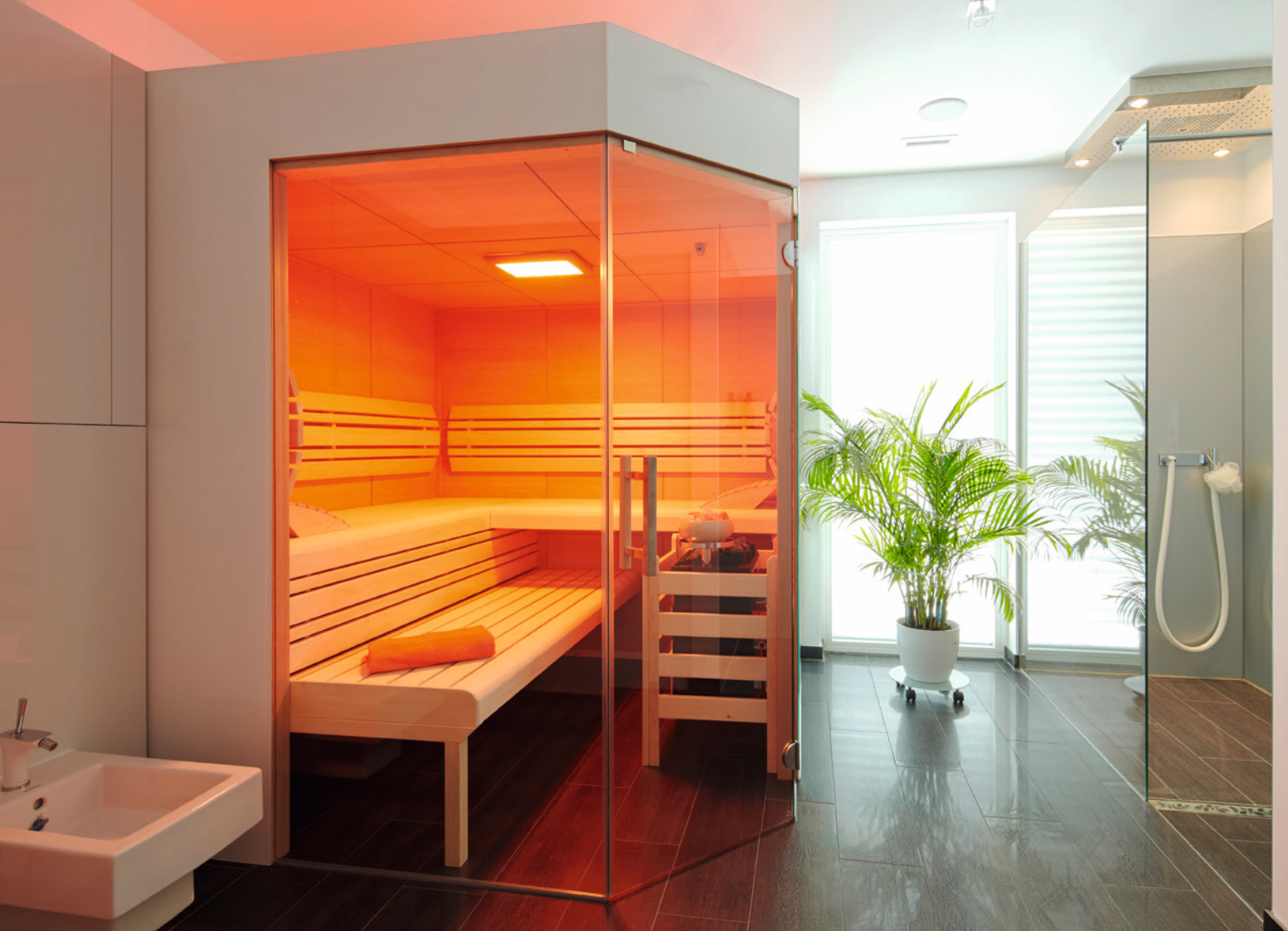
Abbildung Aurora mit Sonderausstattung: EckEinstieg, 2 Glaselemente, Inneneinrichtung Exklusiv, LED-Farblicht, Verdampferofen Bi-O Tec mit Salzverdampfer Holzart innen: Hemlock Paneele, weiÙe Glasplatten auÙen bauseits montiert