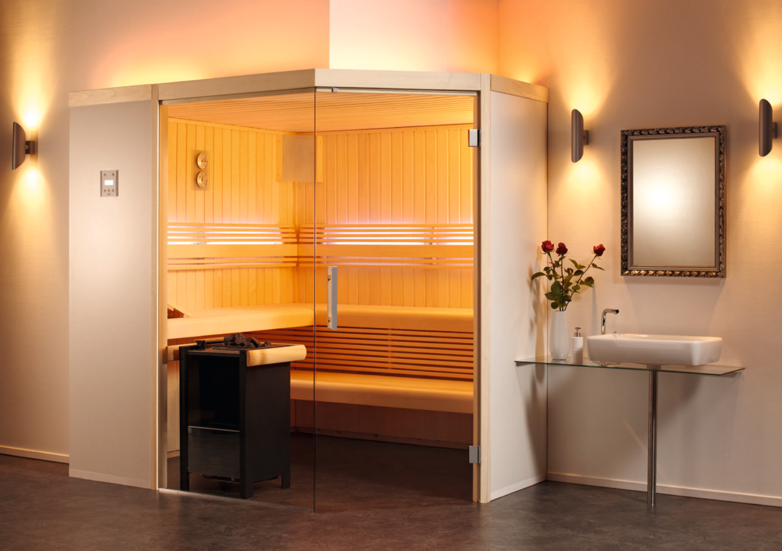
Abbildung Aurora mit Sonderausstattung: Eckeinstieg mit großer Türe ohne Schwelle, großes Glaselement, Inneneinrichtung Premio, LED-Farblicht Sphera als Rückenlehnenbeleuchtung, Verdampferofen Herkules S25 Vapor, Steuerung Saunacontrol Co, Holzart innen: Espe, Rigips-Platten außen weiß gestrichen